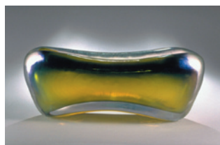
coupe «Sea gold» 1997 verre soufflé et modelé à chaud H.12cm L.32cm P.10cm

Jean-Luc Olivé Conservateur département verre