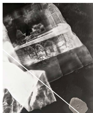
Franck de Villecholle — Ruines du Chateau de Saint-Cloud 1871 Tirage sur papier albuminé © Les Arts Décoratifs