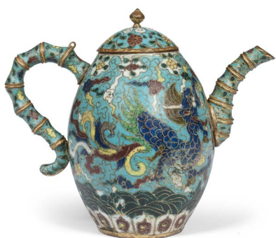
Verseuse — Chine, dynastie Ming (1368-1644), xvi e siècle Émaux cloisonnés sur alliage cuivreux