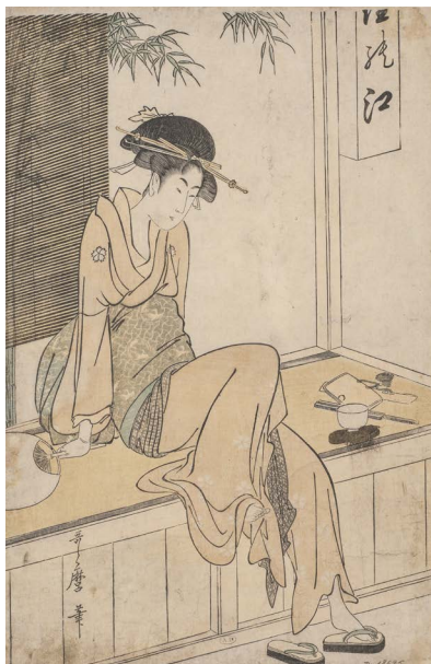
Kitağawa Utamaro — Femme assise au bord d'une véranda Japon, époque d'Edo (1603-1868), vers 1798 Xylographie polychrome sur papier ( nishiki-e)