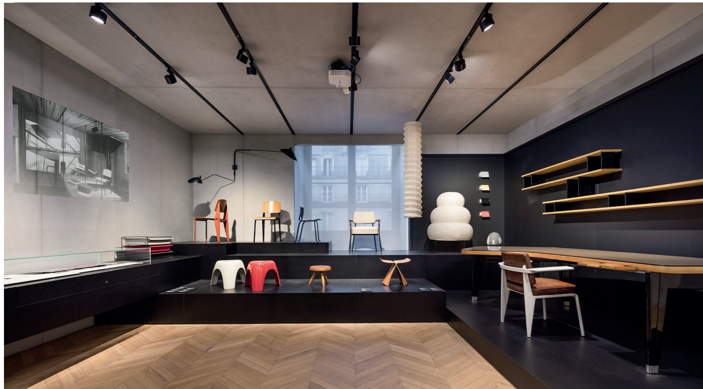
La scénographie des Period Rooms de la collection du XXème et du XXIème siècle sont le point de départ de mes productions qui mêlent à la fois dessins et collages, en plan ou en perspective, concernant les oeuvres ou éléments de la scénographie. Ci-contre, Steph Simon, la galerie Rive gauche.