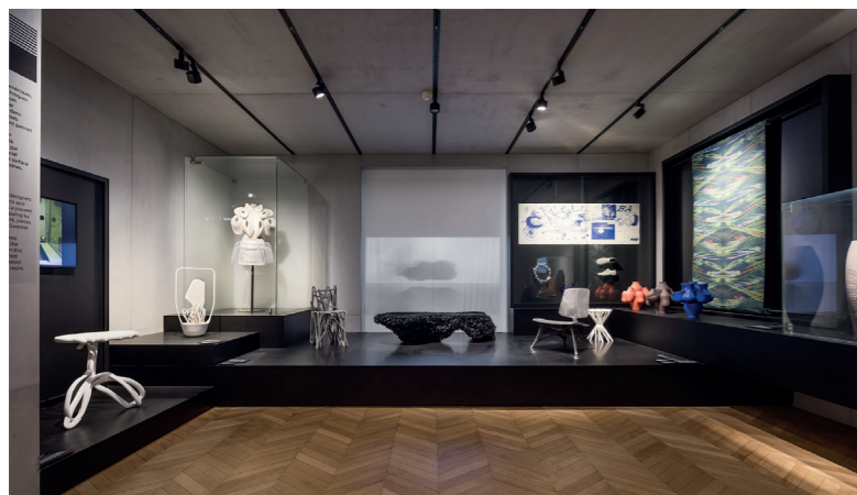
Ci-dessus, Humanisme numérique.