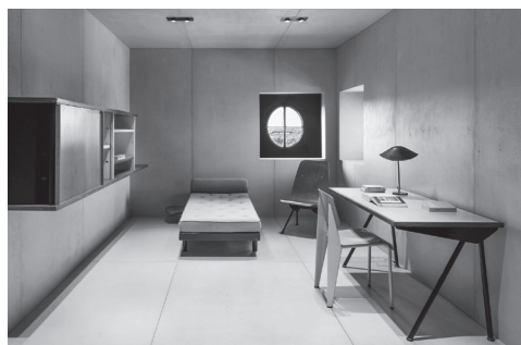
Jean Prouvé (1901-1984) Chambre de la Cité Universitaire d'Antony, 1954