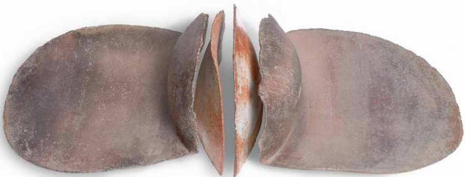
Sculpture Le grand pétale Elisabeth Joulia, France, 1975 Grès Inv. 46191