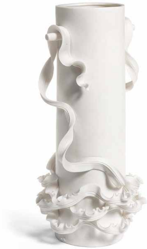
Vase André Dubreuil, France, 2006 Biscuit Inv. 2015.571