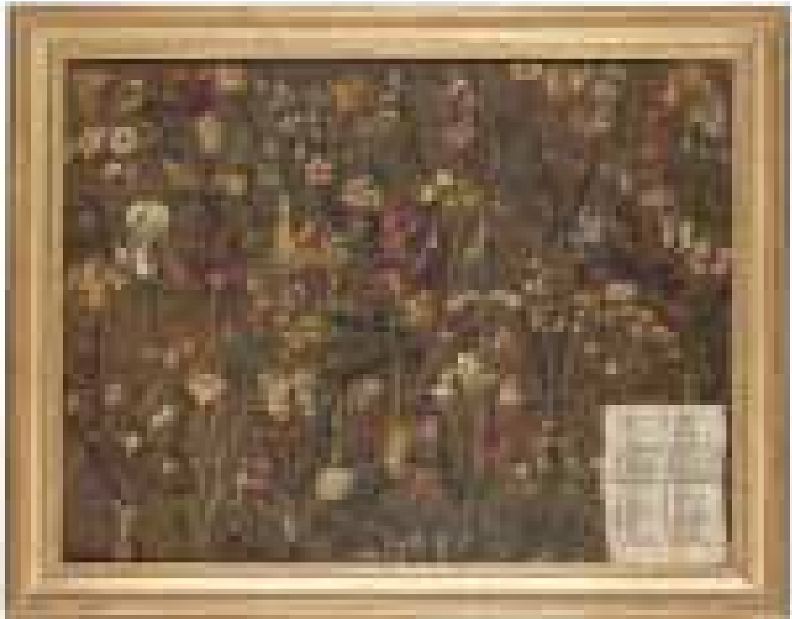
Tableau Etude botanique Girandolo Pini, Italie 1615 huile sur toile Inv. A 123