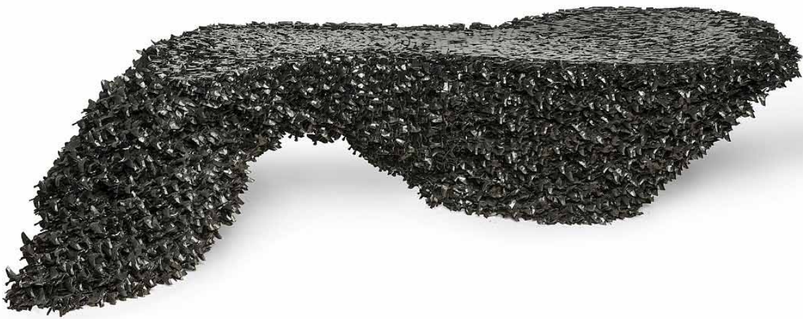
Table Starlings Table et vidéo

Joris Laarman (né en 1979) Pays-Bas, 2010 Résine recouverte de nickel Inv. 2014.58.1