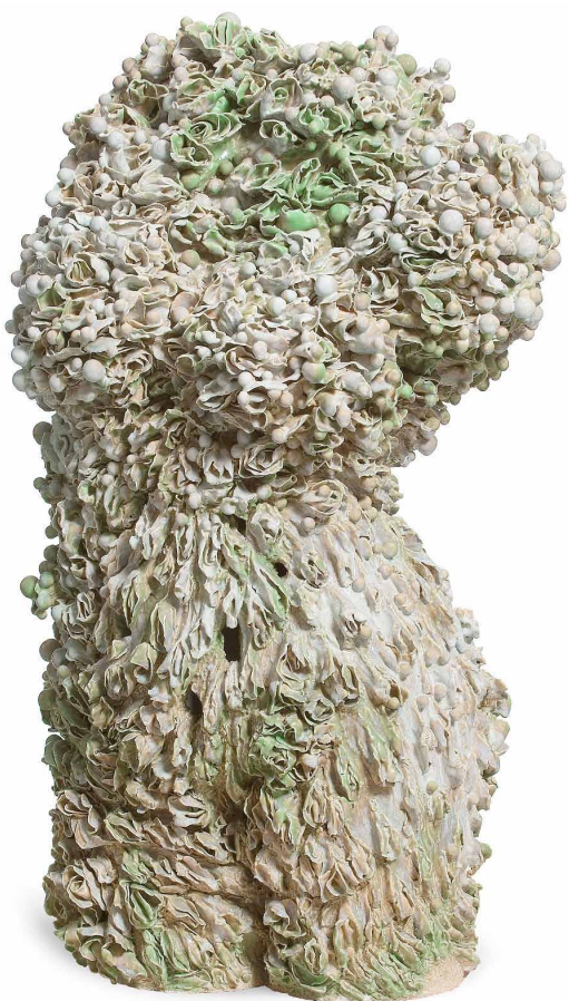
Sculpture Odore di Femmina Johan Creten (né en 1963) France, 2006 Réalisation : Manufacture de Sèvres-Cité de la Céramique Porcelaine chamottée et émaillée, engobe cru et émaillé, multi-cuissons Inv. 2008.2.1