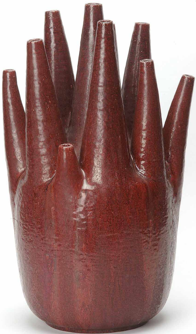
Vase Axel Salto (1889-1961) Manufacture royale de porcelaine de Copenhague Danemark, 1956 Grès chamotté et émaillé Inv. 37936

Axel Salto devient directeur artistique à la manufacture de porcelaine Royal Copenhagen en 1934 et reçoit un grand prix lors de l'Exposition Internationale de Paris en 1937. Tout en continuant en parallèle son travail de dessinateur et de graveur sur bois, il expose ses céramiques dans toute l'Europe. L'observation de la nature est sa source d'inspiration primordiale avec des formes de fruits ou de plantes. L'émail rouge sang-de-bœuf est aussi caractéristique de son œuvre.