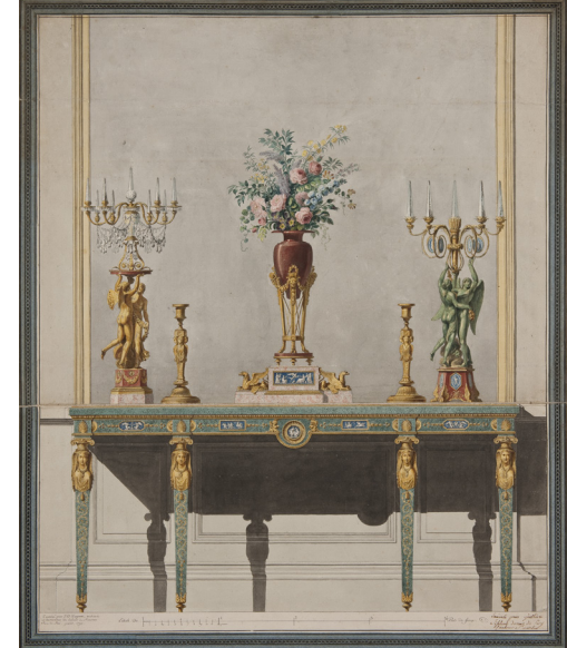
▶ Projet pour une table d'applicque, candélabres, flambeaux et vase Jean-Démosthène Dugourc, vers 1790 Dessin à l'encre noire et aquarelle Musée des Arts décoratifs