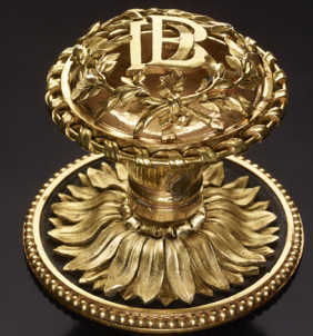
▲ Bouton de porte-fenêtre provenant du pavillon de Louveciennes de Mme Du Barry Pierre Gouthière, vers 1770 Bronze doré Musée des Arts décoratifs