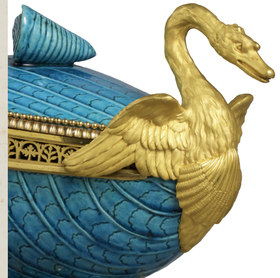
◀ Pot-pourri d'une paire (détail) Pierre Gouthière, 1770-1775 Bronze doré et porcelaine de Chine Musée du Louvre