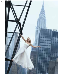
3. - Hiro - octobre 1963 4. - Peter Lindbergh - août 2009 © Peter Lindbergh (courtesy Peter Lindbergh, Paris) 5. - Balenciaga - Robe haute couture Printemps-été 1955, Paris, Musée des Arts Décoratifs 6. - Peter Lindbergh - novembre 1996 © Peter Lindbergh (courtesy Peter Lindbergh, Paris)