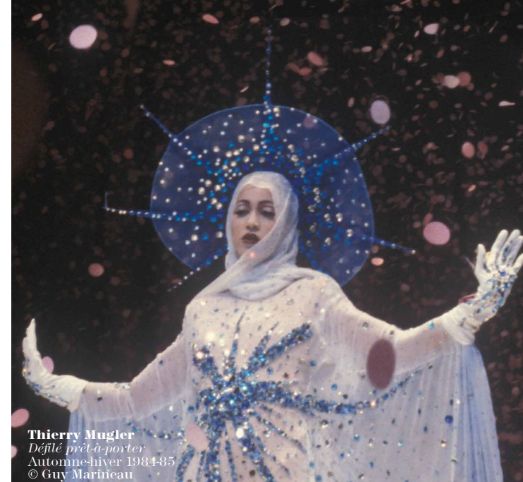
Thierry Mugler Défilé prêt-à-porter Automne-hiver 1984-85

LES ANNÉES 70 & 80 1 ER AVRIL - 10 OCTOBRE 2010