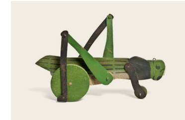
— 5. Anonyme, Sauterelle à tirer, 1930, Musée des Arts Décoratifs, Paris