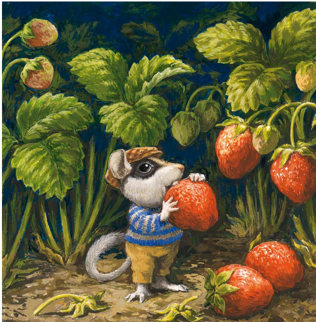
— 2. Antoon Krings, Léo le lérot , 2014 © Gallimard Jeunesse / Giboulées