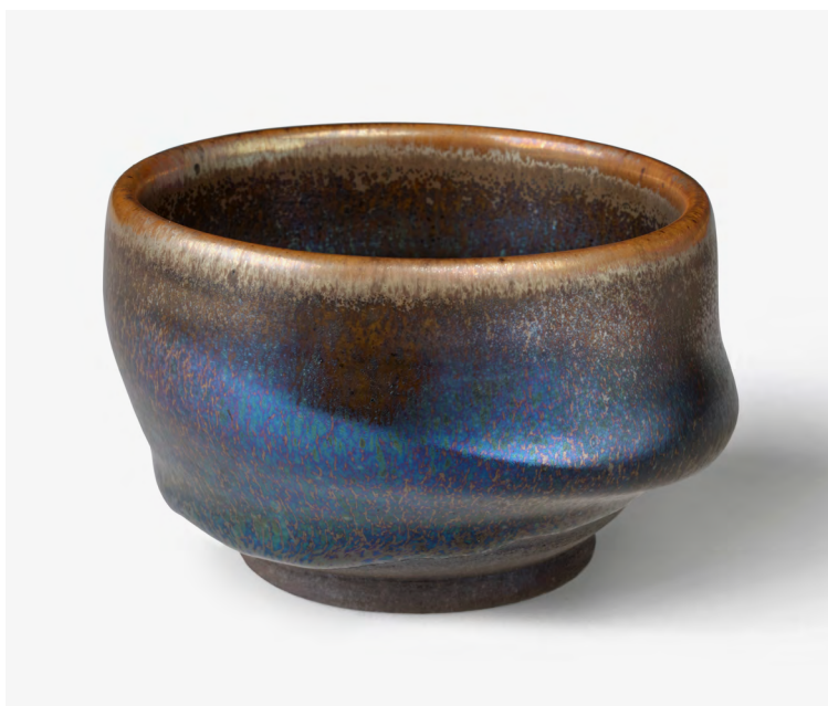
6. Ho Lee Chun — Bol Taïwan, 2018 Grès, couverte de type Jian