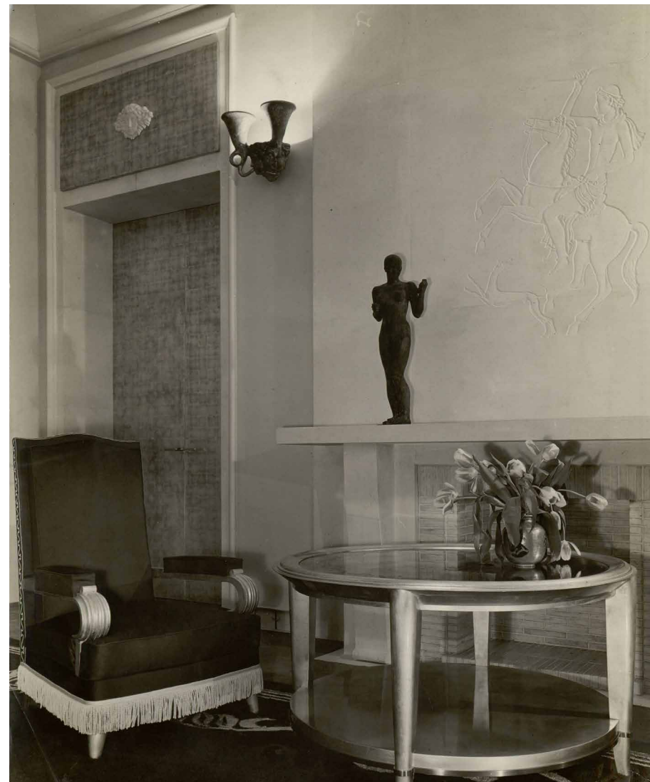
Marcel Dupuis Vue du coin du fumoir de l'appartement de M me Petersen, décoré par André Arbus 1938 Fonds Arbus Photo: Les Arts Décoratifs Paris