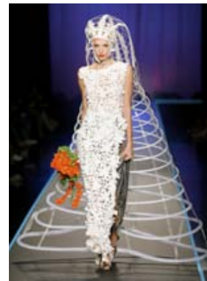
Thierry Mugler, prêt-à-porter, printemps-été 1992, Corps à baleines, 1770-1780, Paris, Les Arts Décoratifs, dépôt du musée de Cluny, La mariée, Jean Paul Gaultier, Gaultier Paris, Haute couture, automne-hiver 2008-2009, collection « Les Cages »