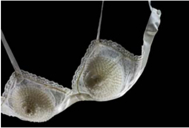
Soutien-gorge , vers 1925, Paris, Les Arts Décoratifs, collection Mode et Textile, photo © Patricia Canino

(Couverture) Corps à baleine , France, vers 1740-1760 Panier à coudes articulé, France, vers 1770, photo © Patricia Canino (Volet intérieur) Faux-cul dit « strapontin », 1887, Paris, Les Arts Décoratifs, collection UFAC, photo © Patricia Canino