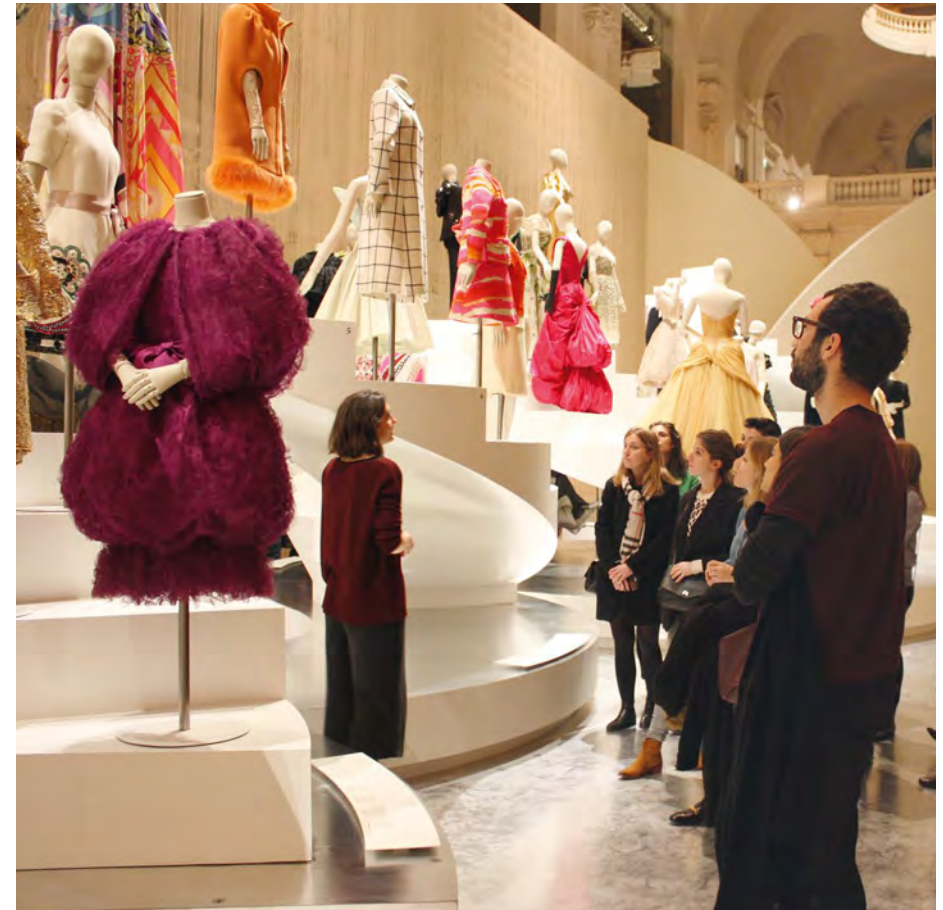
Visite privée organisée avec le Club des Partenaires | 2016

Tax benefits available in France and abroad.