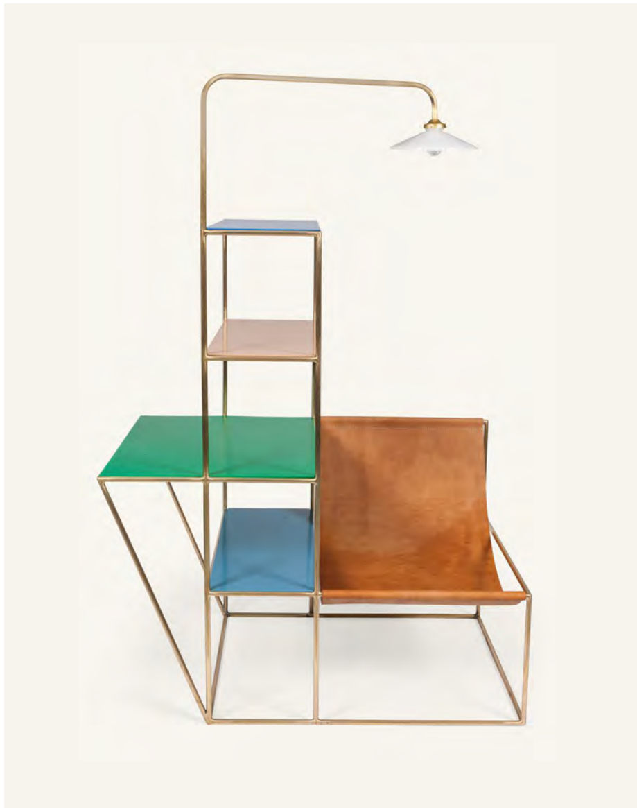
Installation S Fien Muller & Hannes Van Severen 2012 Acquisse grâce au mécénat du Cercle Design 20/21 en 2015