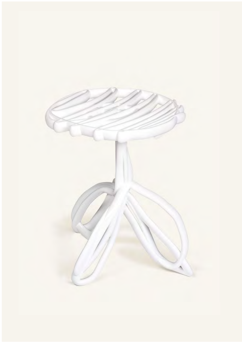
Table Skerch — Front Design 2005 Acquise grâce au mécénat du Cerele Design 20/21 en 2017