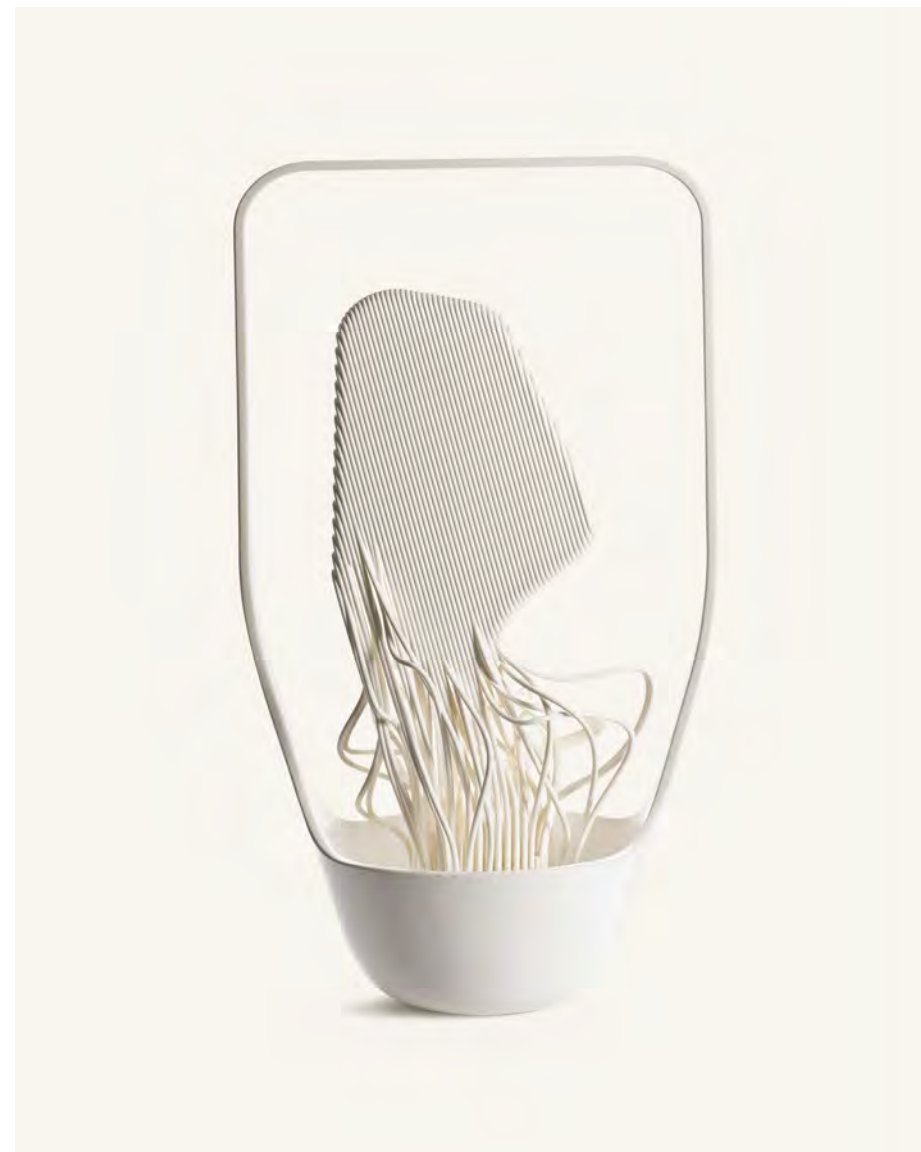
Vase Ikebana Medula Benjamin Graindorge 2010 Acquis grâce au mécénat du Cercle Design 20/21 en 2013