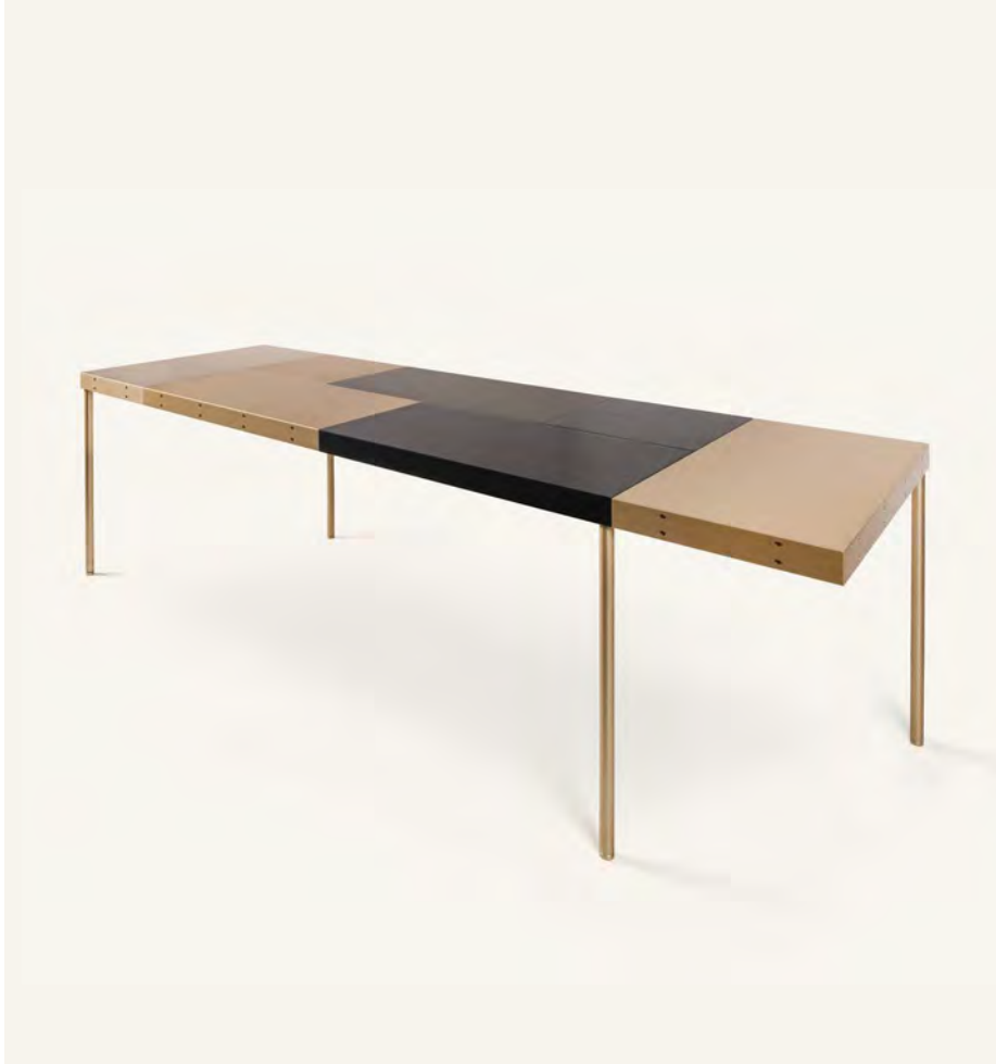
Table de travail MAD-TTR#3 — Martin Szekely 2013 Acquise grâce au mécénat du Cercle Design 20/21 en 2015