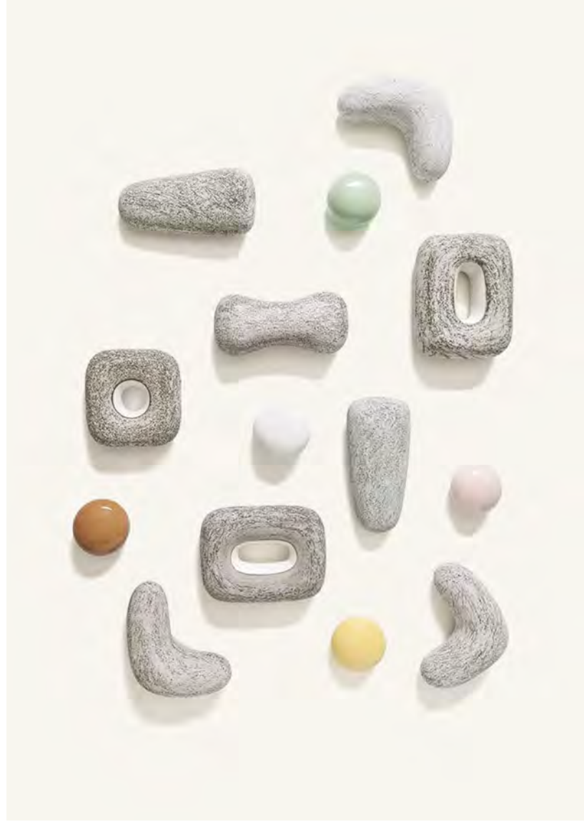
Sculpture Céramique — Kristin McKirdy 2016 Acquise grâce au mécénat du Cerele Design 20/21 en 2016