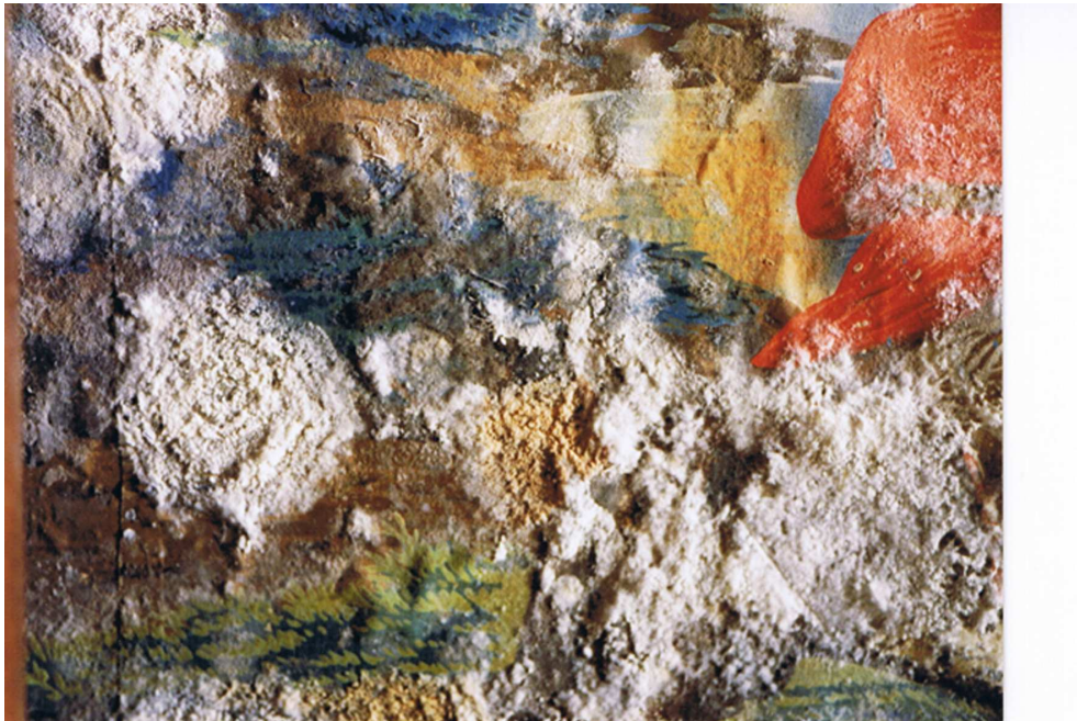
Fig. 4 et 5 : Détails de la contamination microbologique qui a affecté les papiers, Maison-forte Varona à Villanaña.

De même, quand la couche picturale est grossière et qu'il existe un manque de cohésion entre les différentes strates qui la composent, et qu'elle est devenue pulvérulente à cause de la perte de liant, ou qu'il y a un manque d'adhésion du papier au support, la dépose sera également difficile et il sera nécessaire de procéder à une consolidation préalable.