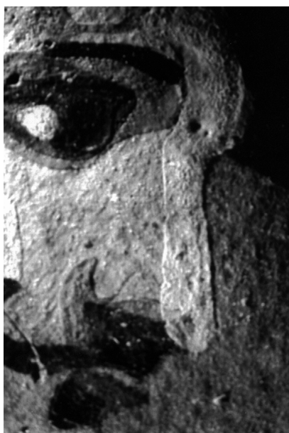
Fig. 1: Détail qui nous a permis de voir la superposition de couches dans le panoramique "Vistas de España", Maison - forte Varona à Villanañe.

Les problèmes de conservation des papiers peints panoramiques sont dus aux composants liés à leur fabrication même, aux dérives climatologiques des demeures dans lesquelles ils se trouvent, et, surtout, aux problèmes générés par leur union au mur, comme nous le verrons par la suite. La fabrication des papiers peints panoramiques est fondée sur l'application de colle à la détrempe, au moyen du procédé d'impression xylographique, dans la majorité des cas. Le procédé d'impression d'une technique comme la détrempe, est dense. Basé sur une superposition de couleurs, ce procédé fait acquérir à la couche picturale une épaisseur assez considérable.