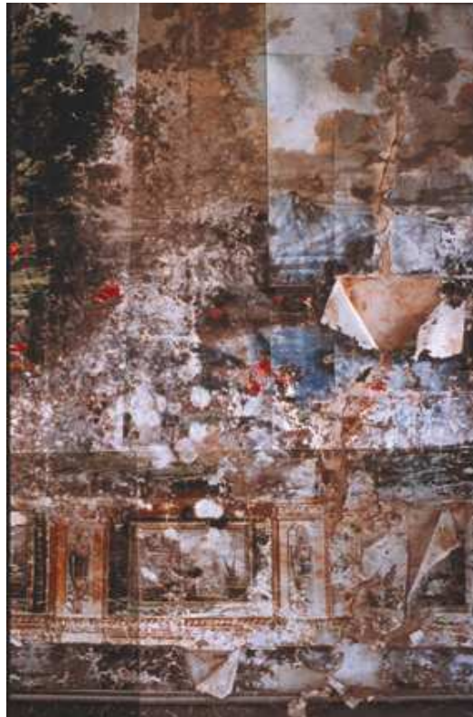
Fig. 3 : Détail des détachements provoqués par la dissolution des colles utilisées pour l'enveloppe du papier peint, Maison – forte Varona à Villanañe.