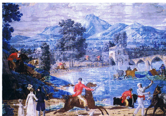
Fig. 7 : Zone du papier peint qui n'était plus contaminée par l'action des micro-organismes, déjà récupérée, Maison – forte Varona à Villanañe.

Les papiers sont collés sur le mur suivant l'ordre établi. Il est important que cette opération soit effectuée par un professionnel instruit et sensibilisé au préalable, à cause de la grande délicatesse de ce type de papiers peints.